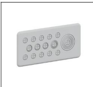
CZF4 Flansch für Rohreinführ.oben EAN Art.-Nr. 2CPX052438R9999 Listenpreis 23.70 €