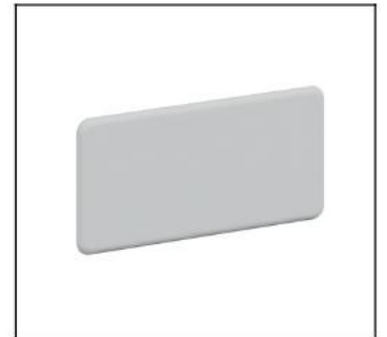
CZF3 Verschlußflansch EAN Art.-Nr. 2CPX052437R9999 Listenpreis 20.60 €