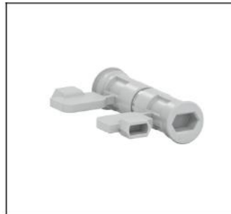
CZ2 Schrankverbindungs-Schrauben EAN Art.-Nr. 2CPX052460R9999 Listenpreis 12.40 €