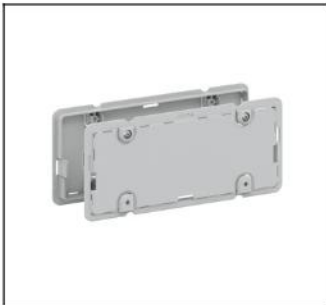
CZ4 Isolierahmen oben/unten EAN Art.-Nr. 2CPX052462R9999 Listenpreis 19.10 €