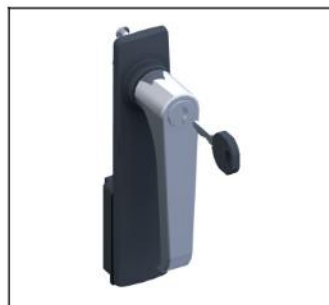
TZ503 Klinkengr.+Schild m.Schloss EAN Art.-Nr. 2CPX010487R9999 Listenpreis 70.00 €