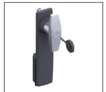
TZ505 Knebelgr.+Schild m.Schloss EAN Art.-Nr. 2CPX010489R9999 Listenpreis 56.50 €