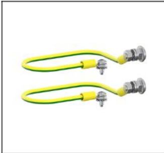
CZL61 Erdungsset KV Aufputz EAN Art.-Nr. 2CPX052449R9999 Listenpreis 17.05 €