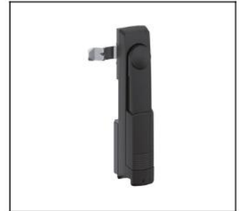
CZT5 Schwenkhebel f.Profilhalbzyl. EAN Art.-Nr. 2CPX052488R9999 Listenpreis 68.00 €