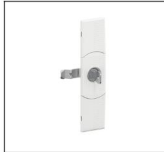
CZT2 Sicherheitsschloß EAN Art.-Nr. 2CPX052412R9999 Listenpreis 35.00 €